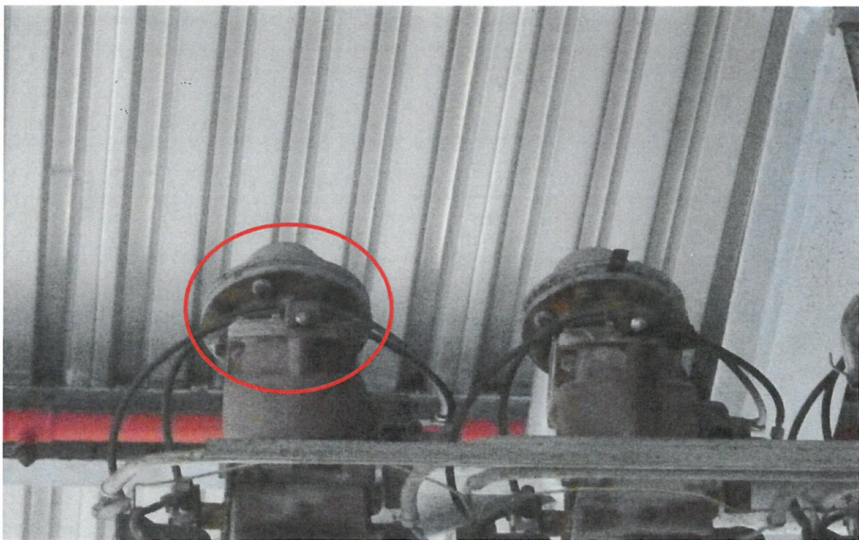
Stopa č.1 – možnosti zaslepení potrubí z acI č.1 do horního plnění pro BA