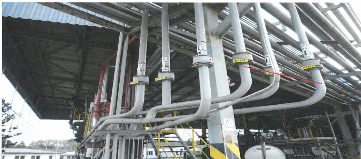
Propojení výdejevého potrubí z nádrží H211B a H211A u lávky č. 1