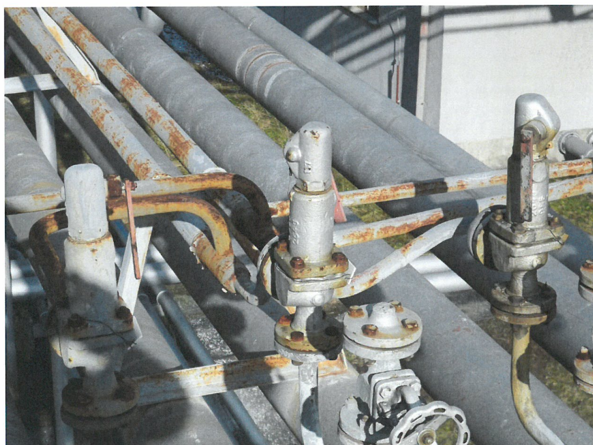
VÝDEJOVÉ POTRUBÍ NA PLNÍCÍ LÁVKY – přepojení pojišťovacích ventilů a osazení 6x ruční kulový ventil