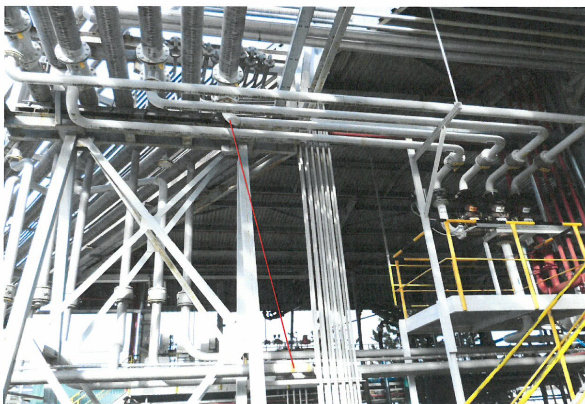
Propojení stávajícího potrubí pro BA z objektu 230 do potrubí s NM pro acI č. 9 a č. 8