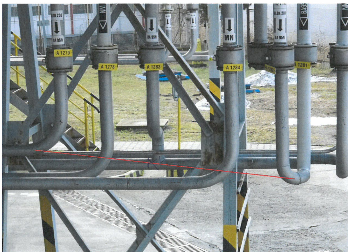
Přepojení potrubí pro acl č. 7 na potrubí pro BA z obj. 201 a 401