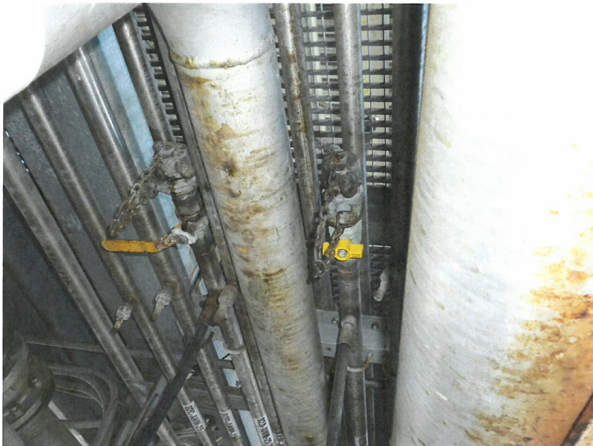
Prodloužení aditivace – dvě tratě na lávce č.1