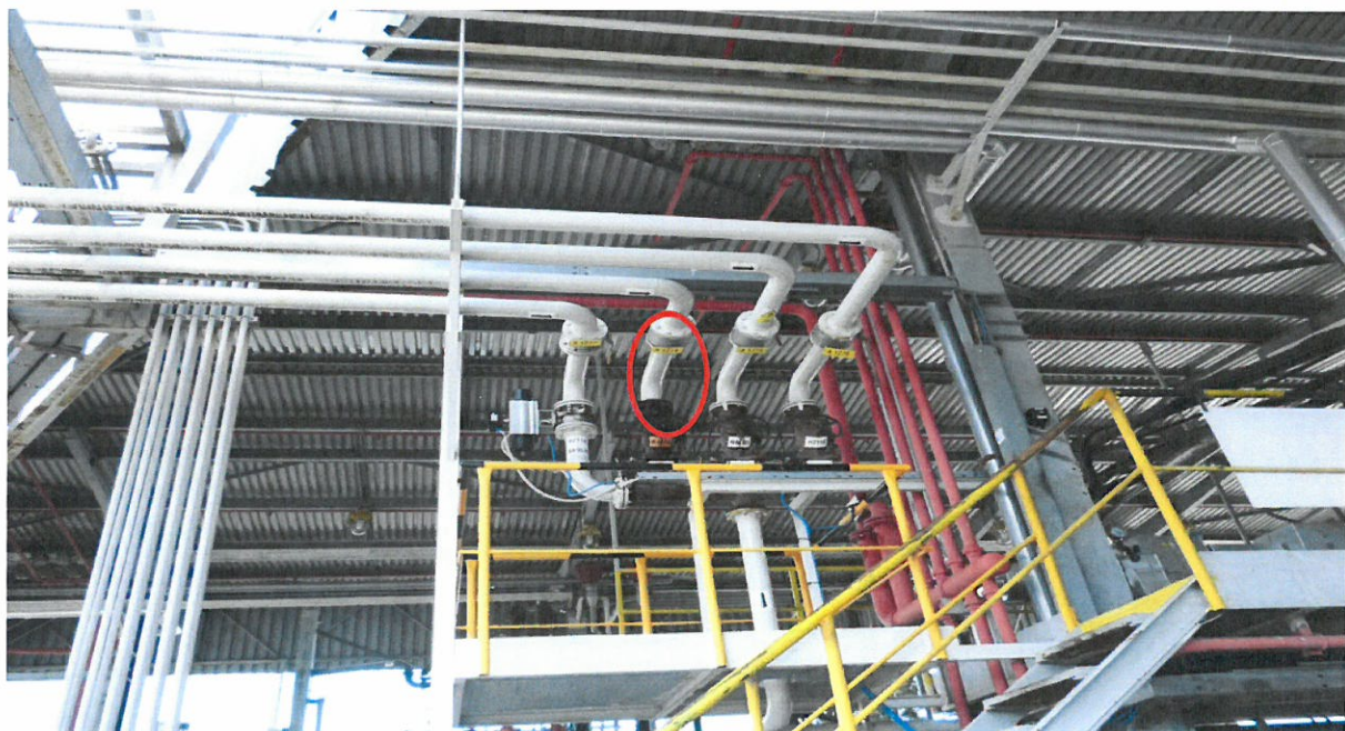
Zaslepení výdejevého potrubí z obj. 230 – BA pro vrchní plnění na stopě č.3