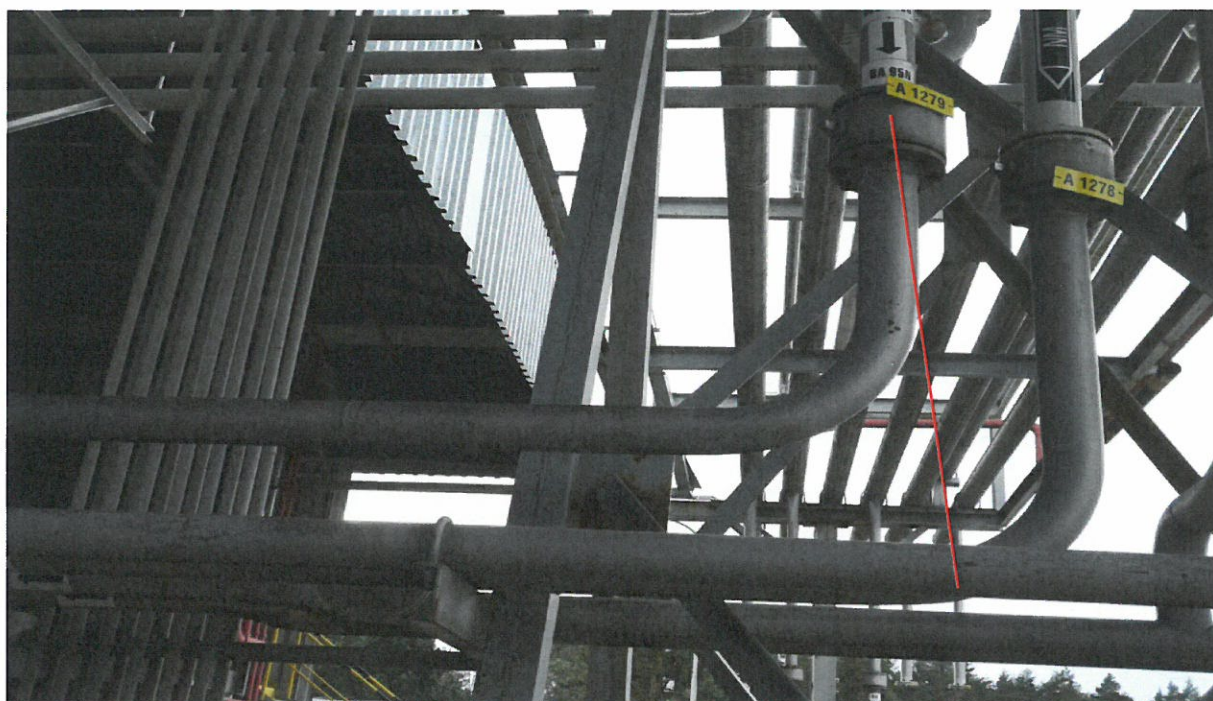
Propojení stávajícího potrubí z obj. 230 pro BA s potrubím pro NM do acl č. 6